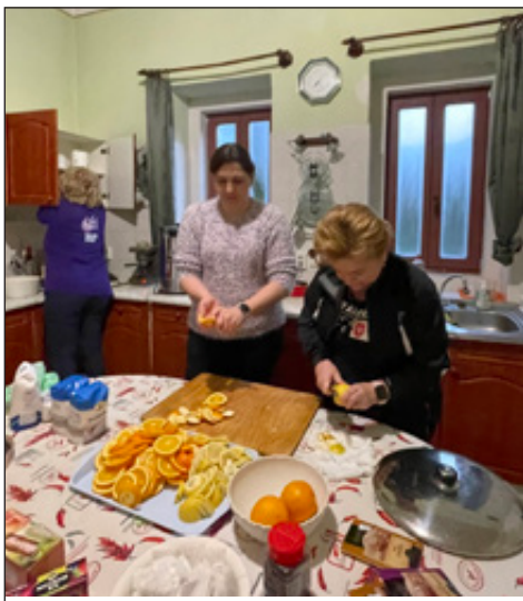
A forralt bor alapanyagainak előkészítése