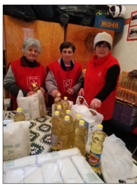
Készülnek a karácsonyi csomagok