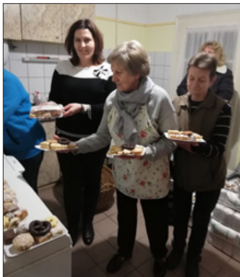
A kiadagolt sütemények zacskózása