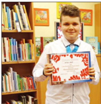
Gyémánt minősítésű mesemondóink