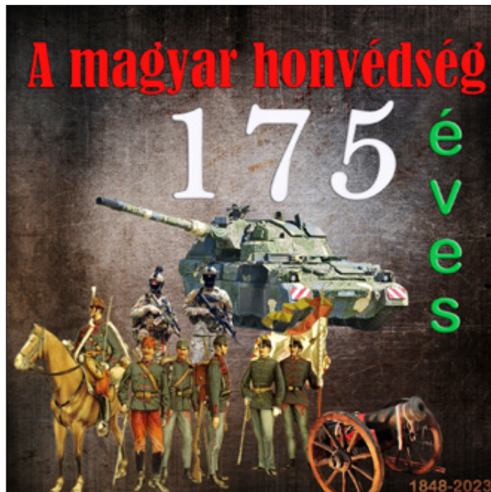
A SZAKI versenyre készített plakátja

A film megtekinthető az itt levő QR-kód segítségével: