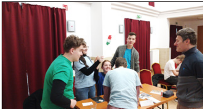
Válaszára jelentkezik az Okosok csapat