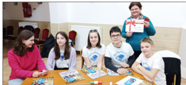
Hunyadi Iskola Csapanév csapata

2024. január 24-én műveltségi vetélkedőre hívtuk a 12-16 éves diákokat. A három iskola 2-2 csapata kreatív feladatokon keresztül idézte fel és gyarapította tudását a Himnuszról és a magyar kultúráról. A jó hangulatú délutánon a csapatok versengtek is egymással. I. helyezett a Szent Anna Iskola Okosokk csapata, II. helyezett SZAKI MűSzaki csapata, III. helyezett Hunyadi Iskola Csapanév csapata lett. A dobogón állóknak és minden résztvevőnek szeretettel gratulálunk! Köszönjük az iskolák együttműködését és a felkészítő pedagógusok munkáját!