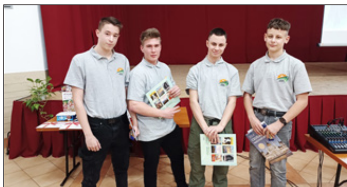
A Naturfeld csapat