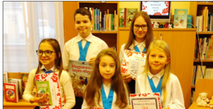
Mesemondásukkal arany minősítést szereztek