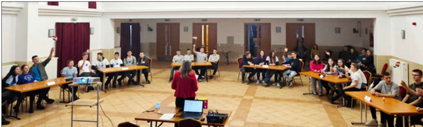
A műveltségi vetélkedőn résztvevő csapatok a megmérettetés során nemzeti színű zászlókkal jelentkeztek válaszára.