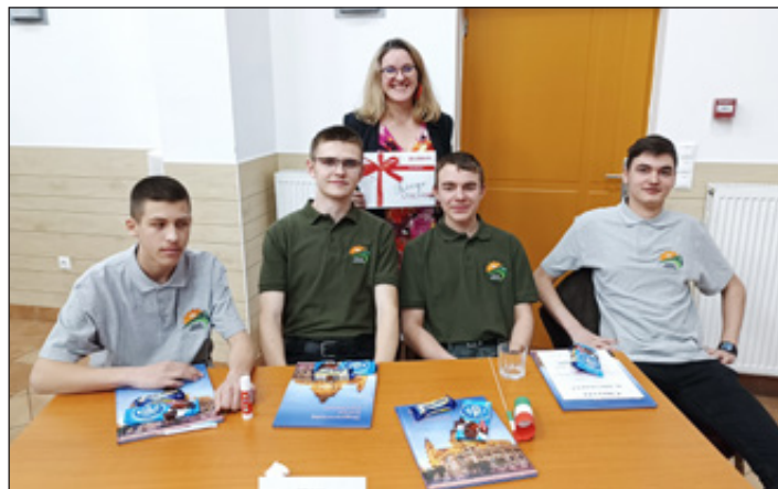
SZAKI MűSzaki csapata