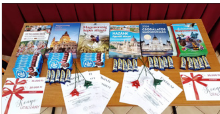
Ezek a jutalmak vártak Műveltségi vetélkedő résztvevő csapataira