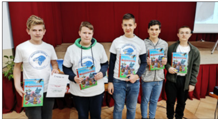
A Hunyadi iskola Noném csapata