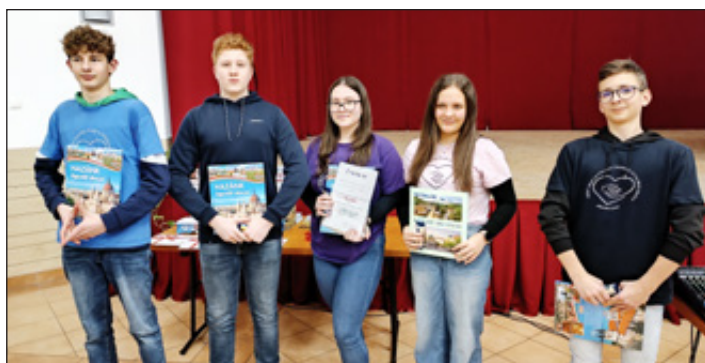
Alföldi Betyárok csapata