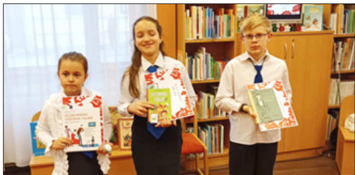
Ezüst minősítésű mesemondók