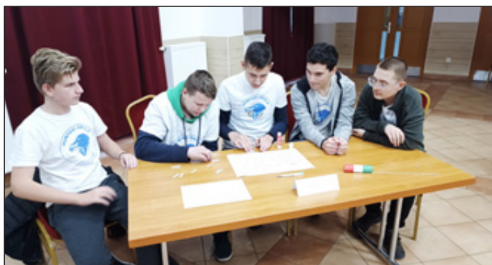
A Hunyadi Iskola csapata a térképes feladatot végzi