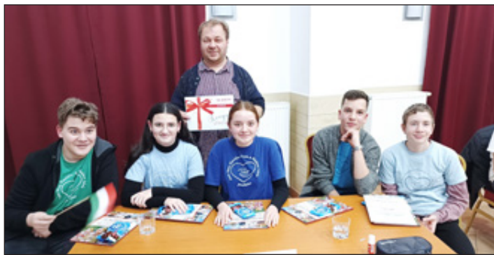
Szent Anna Iskola Okosokk csapata