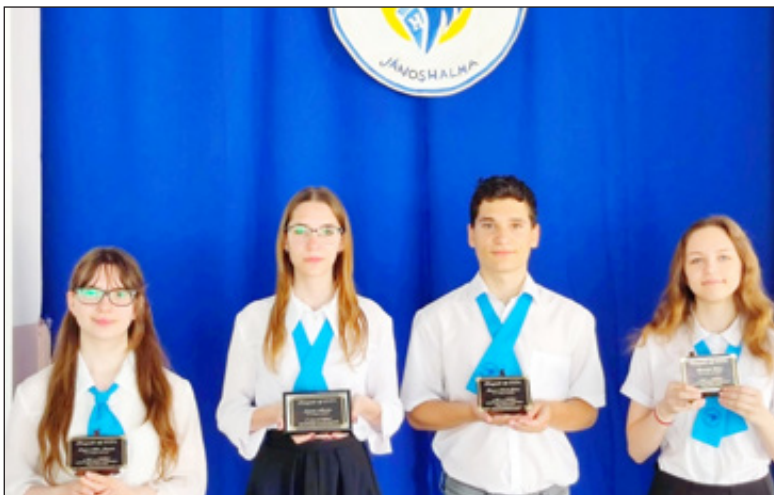
Hunyadi plakettet kaptak