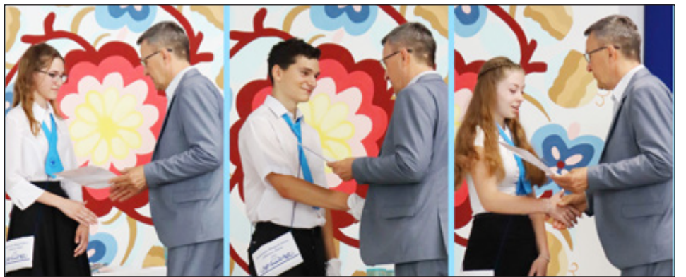
Önkormányzati ösztöndíjban részesültek