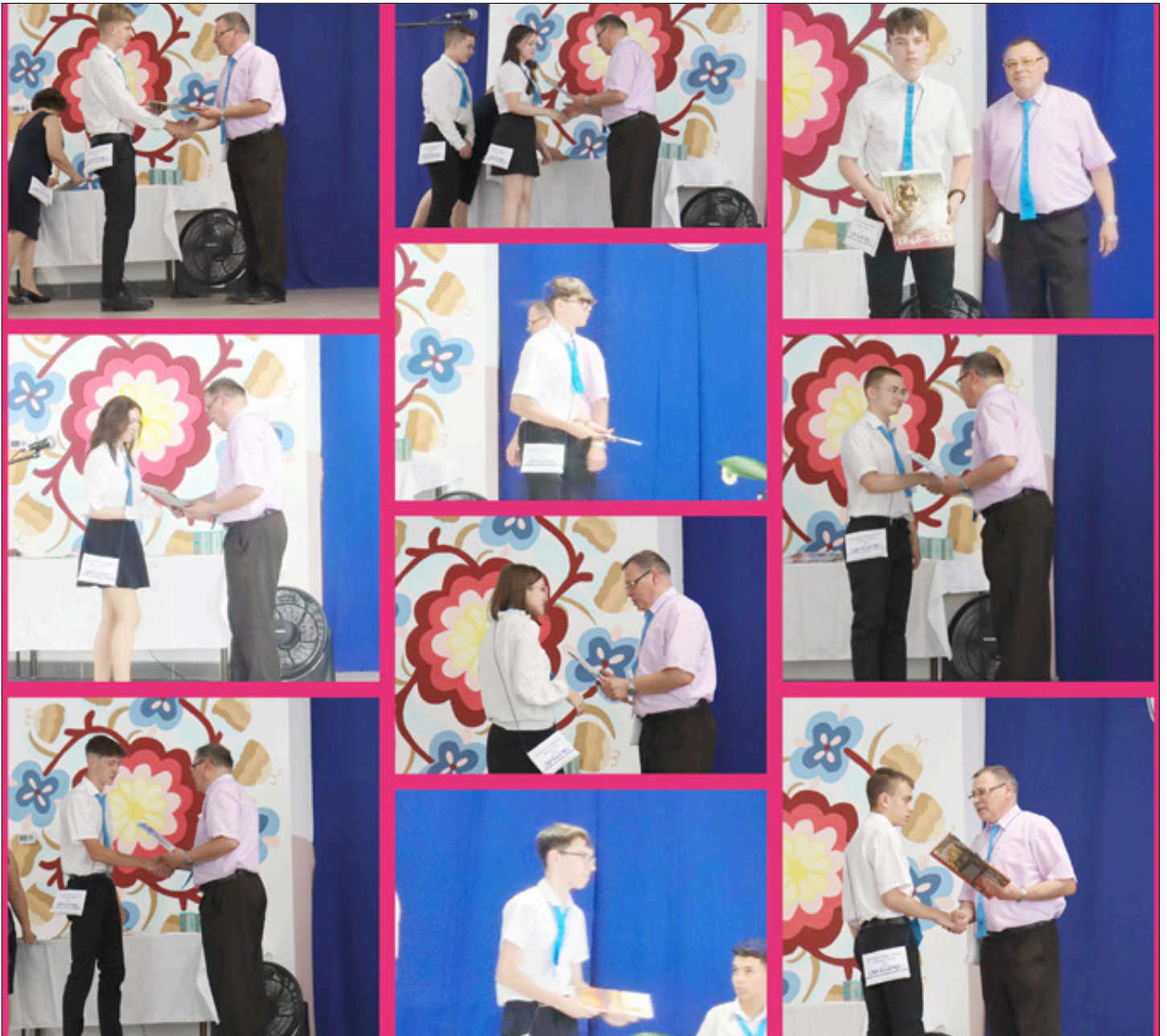
Akik oklevelet vehettek át

Az alábbi útravaló gondolatokkal búcsúztam el ballagó nyolcadikosainktól: