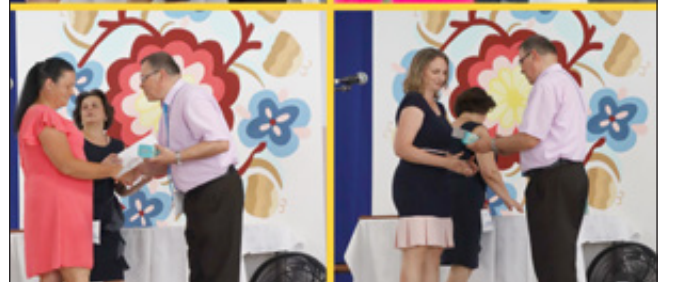
Szülői munkaközösség díjazottai